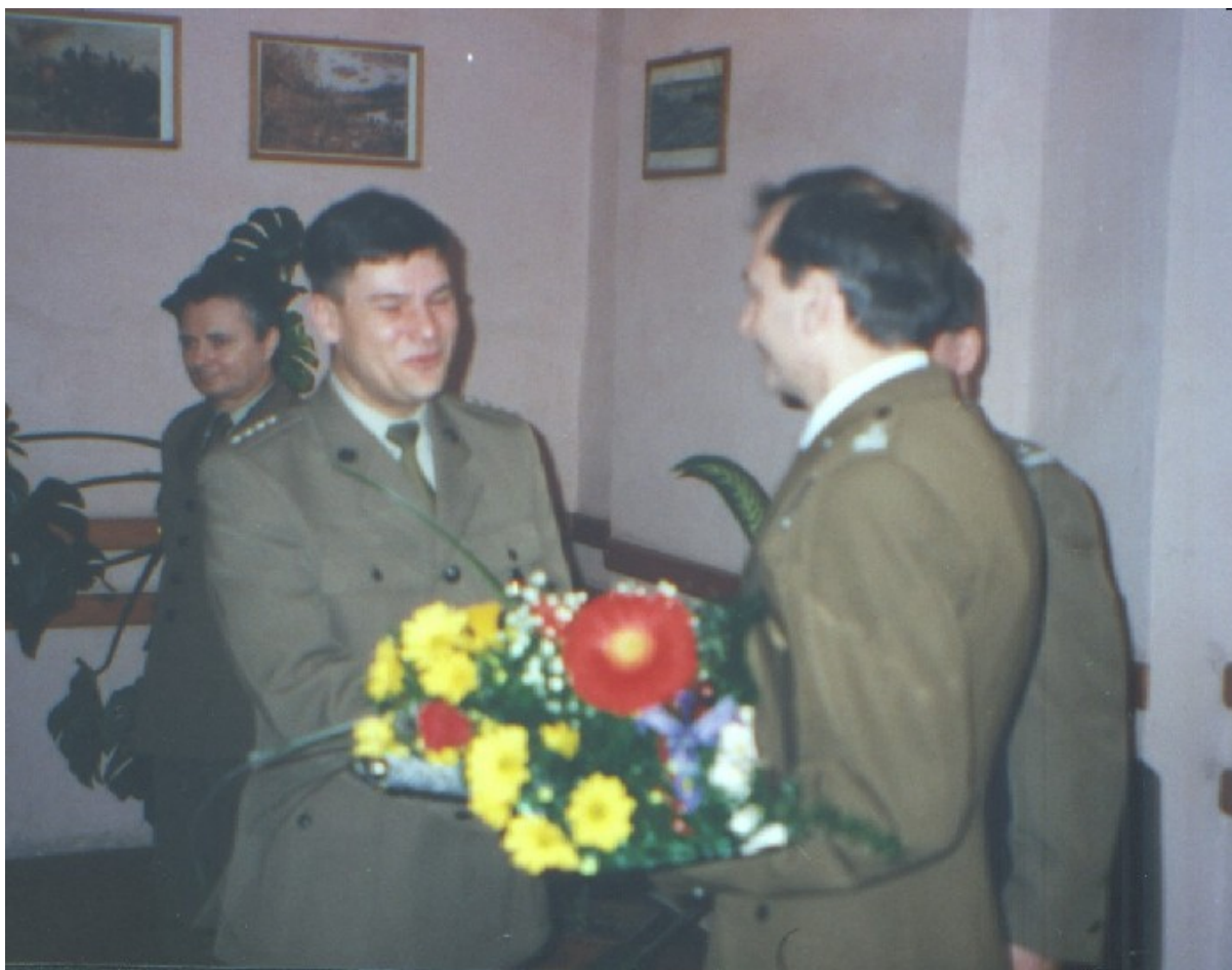
Uroczystość przekazania obowiązków Komendanta OTPS SG w dniu 15 stycznia 1999 roku.