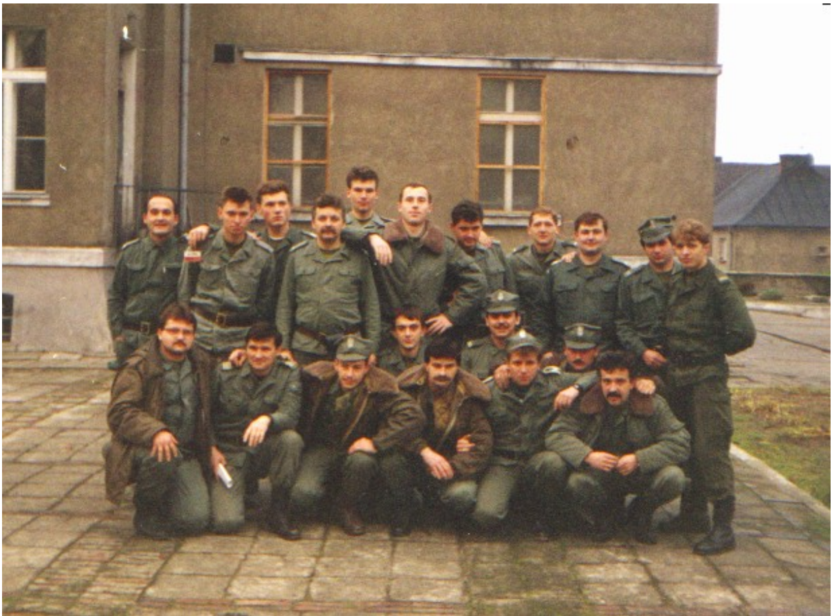
Żarka nad Nysą sierpień 1994 rok, słuchacze kursu psów na literę A.