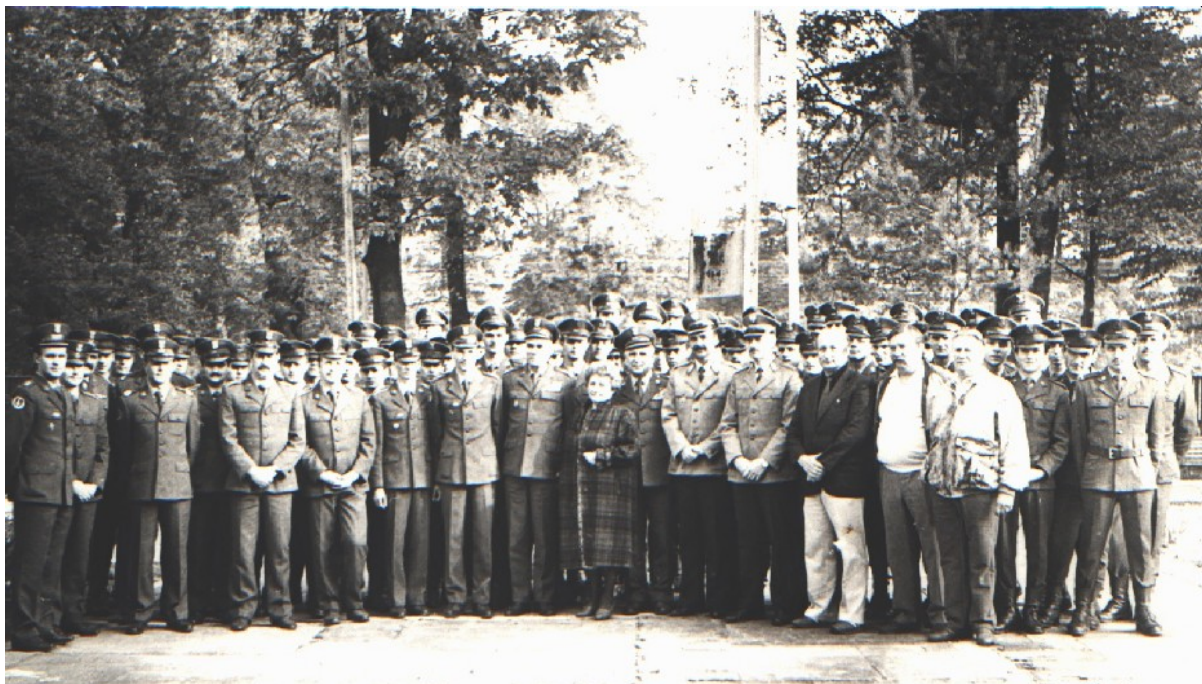
Uroczystość przekazania obowiązków Komendanta OTPS WOP 16 października 1988 roku.