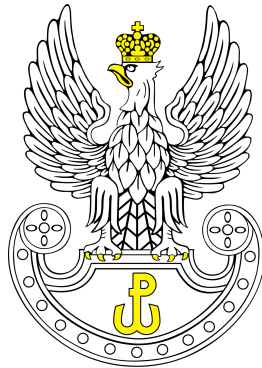
Wojska Obrony Terytorialnej