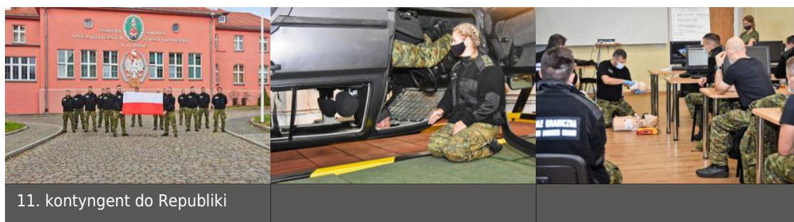
11. kontyngent do Republiki

W trakcie zajęć funkcjonariusze trenowali umiejętności strzeleckie, ćwiczyli taktykę realizacji czynności służbowych w obiektach zurbanizowanych. Szkolenie obejmowało również procedury zatrzymywania oraz doprowadzania osób zatrzymanych, ewakuację i samoewakuację z pojazdu, zasady udzielania pierwszej pomocy oraz przemieszczania się pojazdów uprzywilejowanych w kolumnie. Nasi słuchacze uczestniczyli również w wykładach na temat tradycji i kultury macedońskiej.