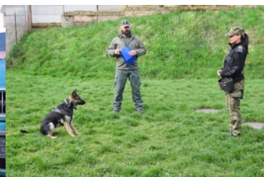
Kurs doskalający instruktorów-selekcjonerów psów specjalnych

Absolwentom kursu życzymy sukcesów i satysfakcji w dalszej pracy z psami.