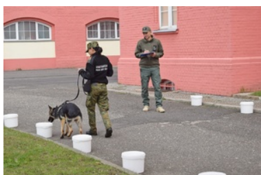
Kurs doskalający instruktrów-selekcjonerów psów specjalnych

Podczas dwumiesięcznego szkolenia kandydaci na instruktorów-selekcjonerów z Morskiego, Warmińsko-Mazurskiego, Nadwiślańskiego, Nadbużańskiego oraz Nadodrzańskiego Oddziału SG zapoznawali się między innymi z zasadami selekcji psów pod kątem ich doboru do służby, organizacją szkoleń dla przewodników z psami, szeroko pojętą wiedzą o psie i metodach jego szkolenia, a także zasadami udzielania pierwszej pomocy, zarówno osobom poszkodowanym w wyniku pogryzienia jak i psom. Kandydaci na instruktorów - selekcjonerów uczestniczyli w zajęciach szkoleń specjalistycznych dla nowo zakupionych psów, początkowo pod baczny okiem asystentów instruktorów, a następnie samodzielnie prowadzili pod ich nadzorem wybrane zajęcia.