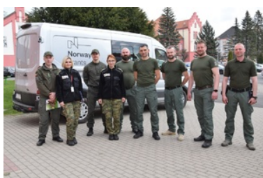
Kurs doskalający instruktorów-selekcjonerów psów specjalnych

Absolwentom kursu życzymy sukcesów i satysfakcji w dalszej pracy z psami.