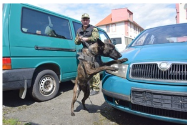
Kurs doskalający instruktorów-selekcjonerów psów specjalnych

Szkolenie zakończyło się egzaminem, w ramach którego każdy z słuchaczy musiał zaprezentować swój warsztat pracy oraz umiejętności, prowadząc samodzielnie zajęcia dla wybranej grupy szkoleniowej, zgodnie z wylosowanymi założeniami egzaminacyjnymi. W trakcie przygotowań do egzaminu, przyszłą kadrę instruktorską wspierali i nadzorowali eksperci z Litwy, udzielając młodym adeptom licznych wskazówek, które pozwoliły na osiągnięcie przez nich jak najlepszych wyników. Dzięki fachowo wyszkolonej, kolejnej grupie instruktorów - selekcjonerów, krok po kroku zbliżamy się do osiągnięcia celu projektu, zakładającego podniesienie zdolności użytkowych psów służbowych we wszystkich Oddziałach Straży Granicznej. W tym roku przewidziana jest jeszcze jedna edycja kursu dla instruktorów - selekcjonerów, zaś projekt zakończy się Międzynarodowymi Zawodami Kynologicznymi - podsumowującymi przedsięwzięcie.