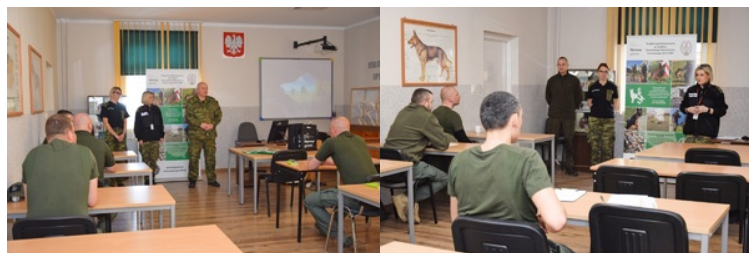
Kurs doskonalający instruktorów- selekcjonerów psów specjalnych

Kurs przeprowadzono w ramach projektu predefiniowanego nr PDP V pn. „Wzmocnienie ochrony granic UE poprzez rozwój kynologicznej działalności szkoleniowej, rozbudowę, przebudowę i doposażenie infrastrukturalne OSS SG”, finansowanego z Programu „Sprawy wewnętrzne”, realizowanego w ramach Funduszy Norweskich 2014-2021. Program pozostaje w dyspozycji Ministra Spraw Wewnętrznych i Administracji.