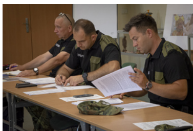
5. kontyngent do Republiki Macedonii Północnej

W trakcie zajęć funkcjonariusze trenowali m.in. umiejętności strzeleckie, ćwiczyli taktykę realizacji czynności służbowych w obiektach zurbanizowanych. Szkolenie obejmowało również procedury zatrzymywania oraz doprowadzania osób zatrzymanych, zasady udzielania pierwszej pomocy oraz przemieszczania się pojazdów uprzywilejowanych w kolumnie. Nasi słuchacze uczestniczyli również w wykładach na temat tradycji i kultury macedońskiej.