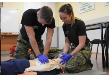
5. kontyngent do Republiki Macedonii Północnej