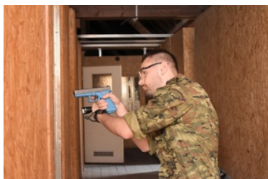
5. kontyngent do Republiki Macedonii Północnej