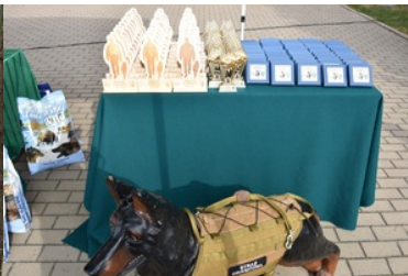
I Międzynarodowe Zawody Kynologiczne