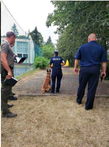
I Międzynarodowe Zawody Kynologiczne