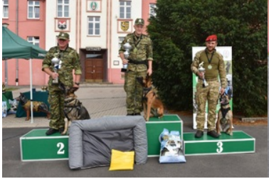
I Międzynarodowe Zawody Kynologiczne