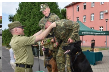
I Międzynarodowe Zawody Kynologiczne