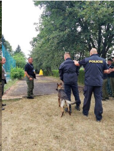
I Międzynarodowe Zawody Kynologiczne