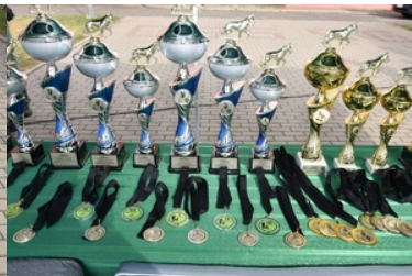
I Międzynarodowe Zawody Kynologiczne