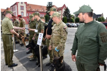
I Międzynarodowe Zawody Kynologiczne