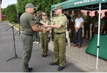
I Międzynarodowe Zawody Kynologiczne