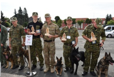
I Międzynarodowe Zawody Kynologiczne