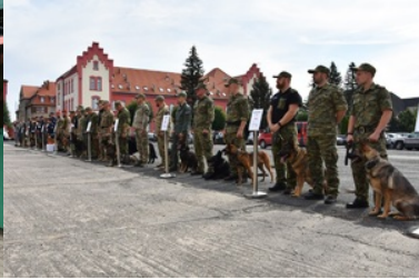
I Międzynarodowe Zawody Kynologiczne