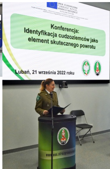
Inauguracja oddania do użytkowania hangaru szkoleniowego wraz z budynkiem internatowym