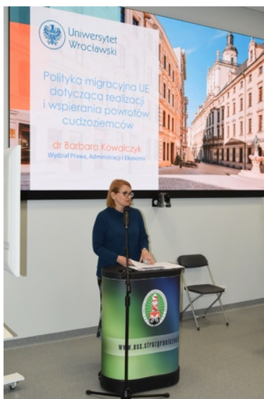
Inauguracja oddania do użytkowania hangaru szkoleniowego wraz z budynkiem internatowym

Konferencja nt. „Identyfikacja cudzoziemców jako element skutecznego powrotu” została zrealizowana w ramach projektu 1/9-2018/BK-FAMI „Wzmocnienie kompetencji i kwalifikacji Straży Granicznej w obszarze powrotów - część II”, współfinansowany z Programu Krajowego Funduszu Azylu, Migracji i Integracji.