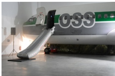
Inauguracja oddania do użytkowania hangaru szkoleniowego wraz z budynkiem internatowym

Obiekt przeznaczony jest do prowadzenia szkoleń dla funkcjonariuszy Straży Granicznej oraz przedstawicieli służb Unii Europejskiej, ale też tych z państw spoza UE, którzy biorą udział w przymusowych operacjach powrotowych, wykonywanych drogą lotniczą i lądową. Będą tu odbywać się szkolenia specjalistyczne, kursy doskonalące i warsztaty, przygotowujące funkcjonariuszy działających jako funkcjonariusze eskortujący, dowódcy doprowadzeń, a także szkolenia innego personelu zaangażowanego w operacje powrotowe. W hangarze obok symulatora samolotu znajdują się również nowoczesne multimedialne sale wykładowe oraz sale treningowe. To jedyny tego typu obiekt szkoleniowy w Polsce.