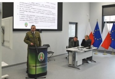
Inauguracja oddania do użytkowania hangaru szkoleniowego wraz z budynkiem internatowym