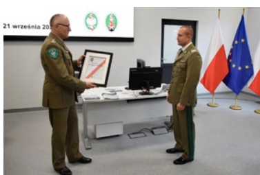
Inauguracja oddania do użytkowania hangaru szkoleniowego wraz z budynkiem internatowym