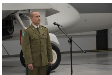
Inauguracja oddania do użytkowania hangaru szkoleniowego wraz z budynkiem internatowym

Uroczystego otwarcia nowo wybudowanego obiektu szkoleniowego dokonał Zastępca Komendanta Głównego Straży Granicznej gen. bryg. SG Grzegorz Niemiec, który podkreślił, jak ważna jest to inwestycja na rzecz służb mundurowych. Ponieważ ten nowoczesny obiekt szkoleniowy będzie miejscem wymiany bogatych doświadczeń polskich funkcjonariuszy z ich kolegami z całego świata, a przede wszystkim umożliwi realizację szkoleń w obszarze prowadzenia wspólnych operacji powrotowych.