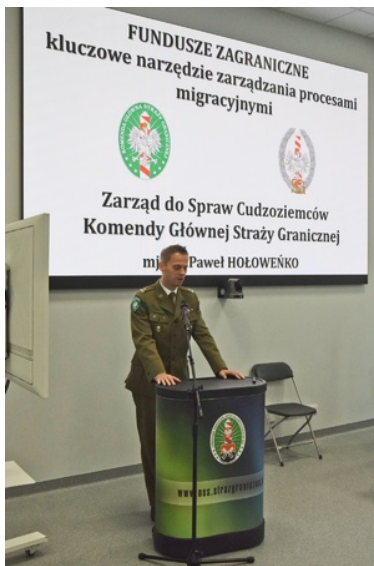
Inauguracja oddania do użytkowania hangaru szkoleniowego wraz z budynkiem internatowym