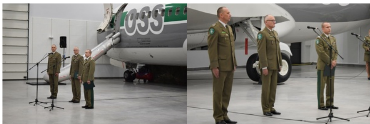
Inauguracja oddania do użytkowania hangaru szkoleniowego wraz z budynkiem internatowym

służb z Państw Członkowskich UE oraz z państw spoza Unii Europejskiej, właściwych w zakresie organizacji i przeprowadzania operacji powrotowych.