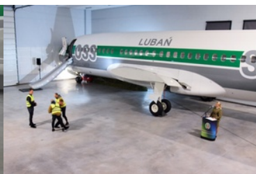
Inauguracja oddania do użytkowania hangaru szkoleniowego wraz z budynkiem internatowym