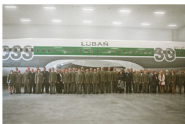
Inauguracja oddania do użytkowania hangaru szkoleniowego wraz z budynkiem internatowym

Przedsięwzięcie swoją obecnością zaszczylicili przedstawiciele Ministerstwa Spraw Wewnętrznych i Administracji, przedstawiciele Agencji Frontex, Komendanci Oddziałów SG i Ośrodków Szkolenia SG. Obecni byli również Dyrektorzy Biur i Zarządów KG SG oraz przedstawiciele Urzędu ds. Cudzoziemców. W uroczystości wzięli udział także przedstawiciele samorządu lokalnego, służb mundurowych oraz instytucji współpracujących z naszym Ośrodkiem.