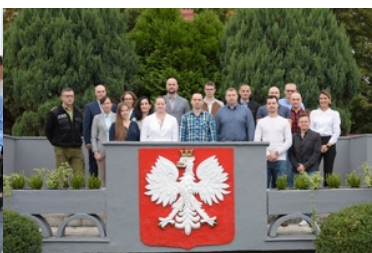
Warsztaty nt. „Wykorzystanie systemów teleinformatycznych w zakresie powrotów cudzoziemców”