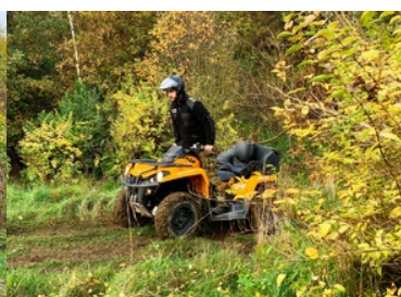
„Trening bezpiecznej jazdy pojazdami ATV w różnych warunkach terenowych - moduł