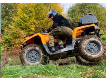
„Trening bezpiecznej jazdy pojazdami ATV w różnych warunkach terenowych - moduł