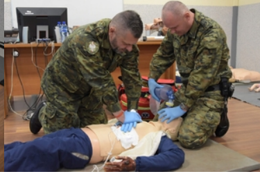
Kolejna grupa funkcjonariuszy Straży Granicznej wyjechała na misje do Republiki Macedonii Północnej