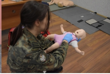
Kolejna grupa funkcjonariuszy Straży Granicznej wyjechała na misje do Republiki Macedonii Północnej