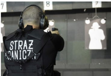
Kolejna grupa funkcjonariuszy Straży Granicznej wyjechała na misje do Republiki Macedonii Północnej