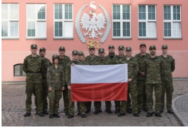
Kolejna grupa funkcjonariuszy Straży Granicznej wyjechała na misje do Republiki Macedonii Północnej