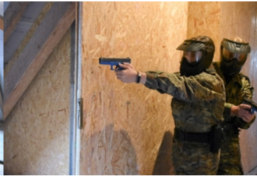
Kolejna grupa funkcjonariuszy Straży Granicznej wyjechała na misje do Republiki Macedonii Północnej