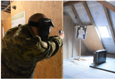
Kolejna grupa funkcjonariuszy Straży Granicznej wyjechała na misje do Republiki Macedonii Północnej