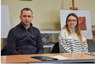
Pierwsza w tym roku edycja kursu doskonalącego nt. „Kontrola legalności pobytu cudzoziemców na terytorium RP”