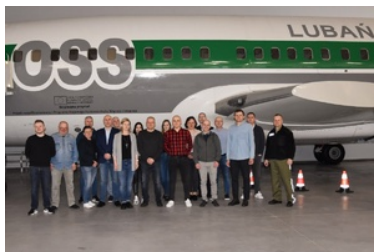
„Spotkanie podzespołu powołanego decyzją nr 159 Komendanta Głównego Straży Granicznej do spraw rozbudowy, dostosowywania i wdrażania w Straży Granicznej Systemu Obsługi Cudzoziemców w ramach Centralnej Bazy Danych Straży Granicznej”