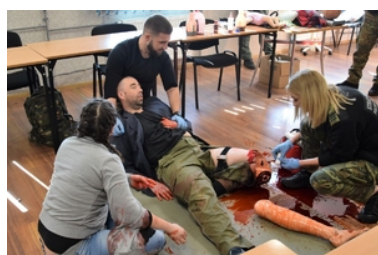
Kursu z zakresu kwalifikowanej pierwszej pomocy

Nad wysokim poziomem szkolenia czuwali prowadzący szkolenie: ratownicy medyczni, funkcjonariusze Państwowej Straży Pożarnej oraz wykładowcy OSS SG w Lubaniu.