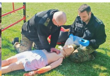
Kursu z zakresu kwalifikowanej pierwszej pomocy