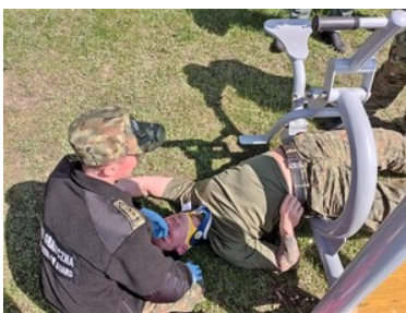
Kursu z zakresu kwalifikowanej pierwszej pomocy