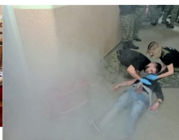
Kursu z zakresu kwalifikowanej pierwszej pomocy