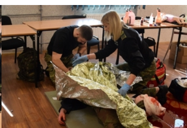
Kursu z zakresu kwalifikowanej pierwszej pomocy