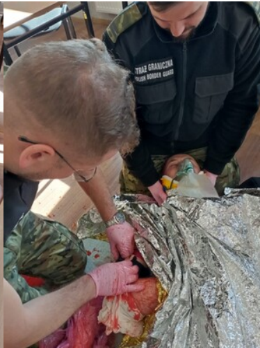
IV edycja kursu z zakresu kwalifikowanej pierwszej pomocy