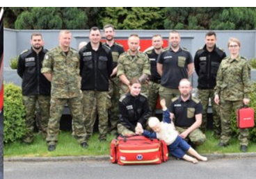
IV edycja kursu z zakresu kwalifikowanej pierwszej pomocy