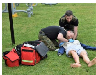
IV edycja kursu z zakresu kwalifikowanej pierwszej pomocy

Nad wysokim poziomem szkolenia czuwali prowadzący szkolenie: ratownicy medyczni, funkcjonariusze Państwowej Straży Pożarnej oraz wykładowcy OSS SG w Lubaniu.