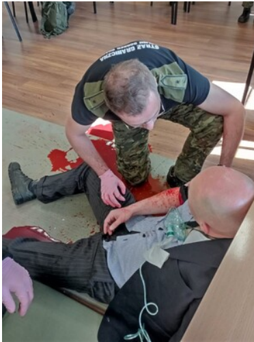
IV edycja kursu z zakresu kwalifikowanej pierwszej pomocy