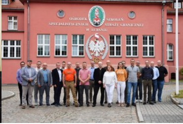
Warsztaty dla Służby Dyżurnej Operacyjnej