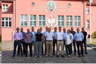
Warsztaty dla Służby Dyżurnej Operacyjnej