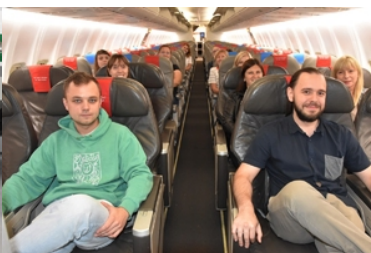
Szkolenie dla pracowników Wydziału Spraw Obywatelskich i Cudzoziemców Dolnośląskiego Urzędu Wojewódzkiego we Wrocławiu