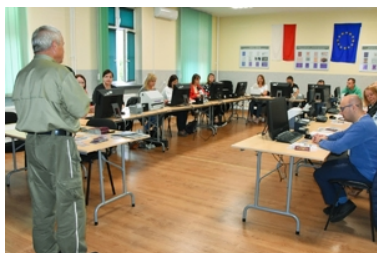
Szkolenie dla pracowników Wydziału Spraw Obywatelskich i Cudzoziemców Dolnośląskiego Urzędu Wojewódzkiego we Wrocławiu