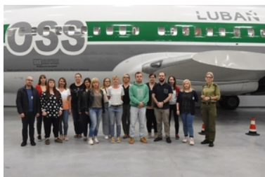
Szkolenie dla pracowników Wydziału Spraw Obywatelskich i Cudzoziemców Dolnośląskiego Urzędu Wojewódzkiego we Wrocławiu

W trakcie zajęć uczestnicy zdobyli wiedzę z zakresu zabezpieczeń stosowanych w dokumentach oraz nabyli praktyczne umiejętności weryfikacji autentyczności dokumentów i rozpoznawania fałszerstw. Omówiono zasady postępowania administracyjnego, prawa i obowiązki cudzoziemców w postępowaniu o zobowiązaniu cudzoziemca do powrotu oraz zagadnienia z zakresu terminów procesowych i materialnych, w kontekście postępowań prowadzonych wobec cudzoziemców.