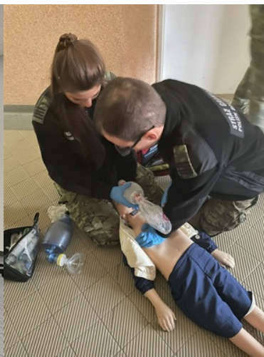
Kurs doskonalący z zakresu kwalifikowanej pierwszej pomocy