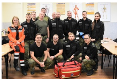
Kurs doskonalący z zakresu kwalifikowanej pierwszej pomocy

Nad wysokim poziomem szkolenia czuwali prowadzący szkolenie: ratownicy medyczni, funkcjonariusze Państwowej Straży Pożarnej oraz wykładowcy OSS SG w Lubaniu.