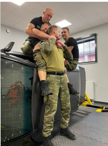
Kurs doskonalący z zakresu kwalifikowanej pierwszej pomocy