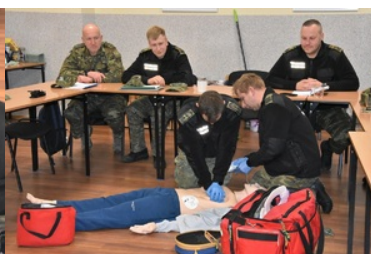
Kurs doskonalący z zakresu kwalifikowanej pierwszej pomocy