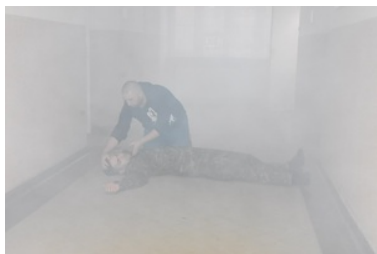
Kurs doskonalący z zakresu kwalifikowanej pierwszej pomocy