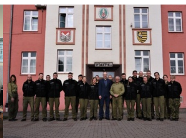
Warsztaty nt.: „Dokumenty publiczne – podstawa prawna, wytwórczość i ich zabezpieczenia”