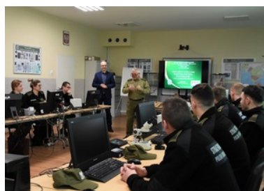
Warsztaty nt.: „Dokumenty publiczne – podstawa prawna, wytwórczość i ich zabezpieczenia”

Warsztaty realizowano w ramach wieloletniej współpracy Zakładu Ogólnozawodowego Ośrodka Szkoleń Specjalistycznych Straży Granicznej w Lubaniu z Polską Wytwórnią Papierów Wartościowych.