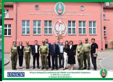
Zdjęcie grupowe przedstawicieli OBWE, Republiki Kirgistanu oraz funkcjonariuszy OSS SG w Lubaniu na tle budynku