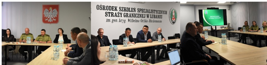
Dwóch Komendantów Ośrodka oraz przedstawiciele OBWE oraz Republiki Kirgistanu w sali odpraw Ośrodka. W tle godło RP

w kontekście ewentualnego włączenia się OSS SG do projektu, który ma celu poprawę bezpieczeństwa w regionie, poprzez zmniejszenie ryzyka rozprzestrzeniania się nielegalnej broni, amunicji i materiałów wybuchowych przez granicę Republiki Kirgiskiej.