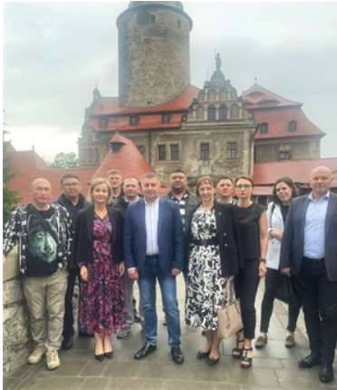
Zdjęcie grupowe na tle zamku Czocho