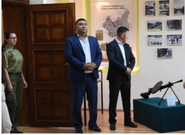
Funkcjonariuszka SG oraz przedstawiciele Republiki Kirgistanu w Sali Tradycji Ośrodka