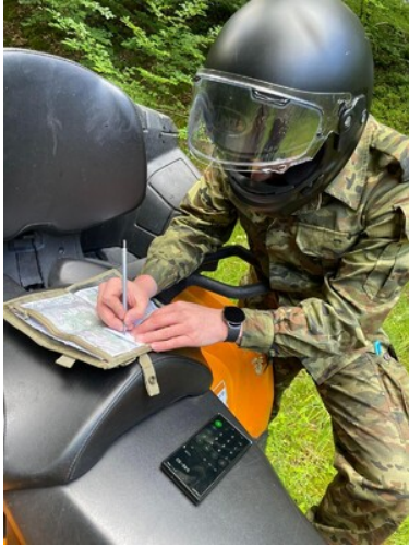
Funkcjonariusz na pojeździe ATV w terenie