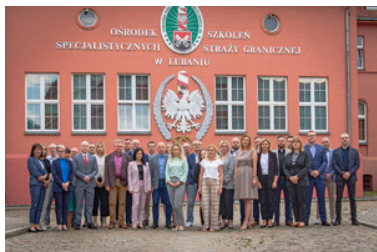
Zdjęcie grupowe funkcjonariuszy i prowadzących przed budynkiem Ośrodka