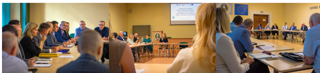
Funkcjonariusze SG w trakcie warsztatów w auli

Przedstawiono także obszary problematyczne wraz z propozycją ich rozwiązania praktycznego, mającego na celu poprawę jakości wykonywanych zadań.