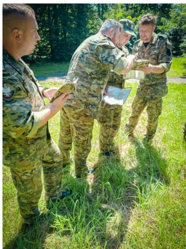
Funkcjonariusze SG w trakcie zajęć w terenie z użyciem map

Głównym celem pierwszej części szkolenia było doskonalenie umiejętności poruszania się pojazdami ATV nabytymi na I etapie szkolenia, które mają wpływ na poziom bezpieczeństwa funkcjonariuszy w trakcie wykonywania zadań służbowych. W drugiej części zajęć słuchacze w praktyce musieli wykazać się wiedzą z zakresu nawigowania w nieznanym terenie przy użyciu mapy i urządzenia GPS. Funkcjonariusze mieli za zadanie odnaleźć się w terenie, wyznaczyć punkty oraz zaplanować trasy przejazdów pojazdami ATV.