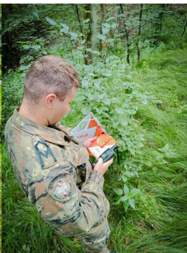
Funkcjonariusz SG w trakcie zajęć w terenie z urządzeniami GPS