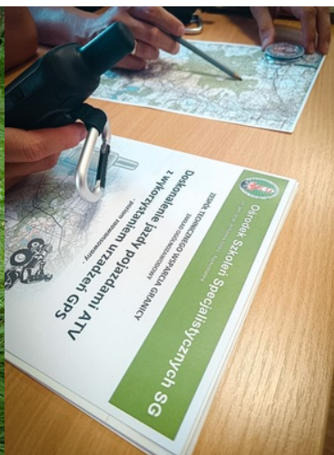
Wyznaczanie trasy na mapie