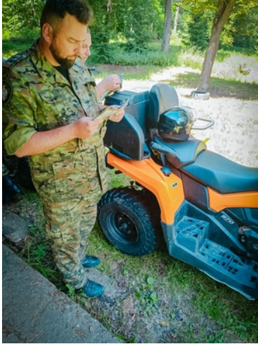
Funkcjonariusz SG w trakcie zajęć w terenie na pojeździe ATV