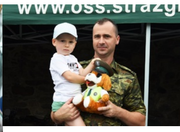
Funkcjonariusz SG oraz chłopiec z maskotką SG