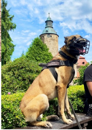
Pies służbowy SG