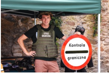
Mężczyzna ze sprzętem służbowym SG