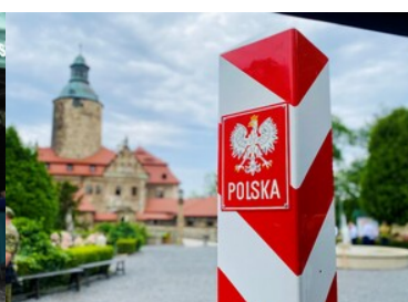
Słup graniczny na tle zamku czocha