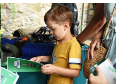
Chłopiec przy stoisku promocyjnym SG