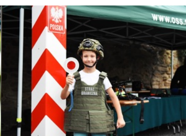
Chłopiec ze sprzętem służbowym SG. W tle stoisko promocyjne