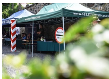
Stoisko promocyjne SG

Największą uwagę odwiedzających przyciągnęły psy służbowe, które również uczestniczyły w wydarzeniu. Fani militariów z entuzjazmem oglądali uzbrojenie i sprzęt służbowy oraz zadawali mnóstwo pytań dotyczących służby naszych czworonożnych partnerów. Każdy mógł przymierzyć kamizelkę kuloodporną, nałożyć hełm, a nawet pogłaskać psa. Wydarzenie było doskonałą okazją do pokazania młodym ludziom, jakie możliwości oferują służby mundurowe i dlaczego warto wstąpić w szeregi Straży Granicznej.