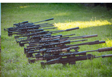
Broń leżąca na trawie