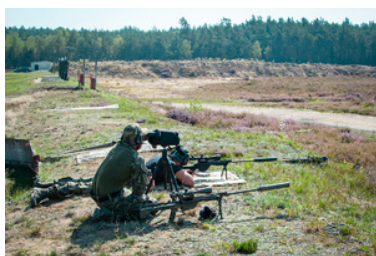
Funkcjonariusze SG podczas zajęć na strzelnicy

Ćwiczenia praktyczne obejmowały strzelanie precyzyjne na dystansie do 200 metrów, gdzie margines błędu był minimalny, a zadania strzeleckie realizowane były w reżimie czasowym. Następnie uczestnicy strzelali na dystansie do 700 metrów. Podczas tego ćwiczenia, aby potwierdzić trafienie w określony cel, kluczowe było poprawne odczytanie warunków atmosferycznych, takich jak siła i kierunek wiatru, temperatura oraz miraż.