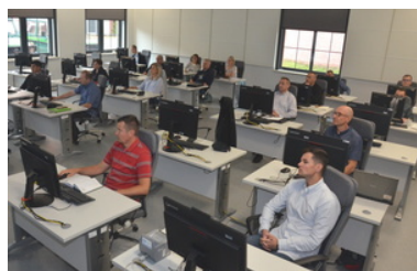
Uczestnicy szkolenia w trakcie zajęć w sali komputerowej Ośrodka

Tematyka zajęć związana była z zarządzaniem systemami informatycznymi CMA ZSE 6 i SWK, w tym zarządzaniem użytkownikami oraz przydzielaniem profili, uprawnień w zakresie właściwości merytorycznej. Omówiono treści związane z nadzorem nad jakością danych zamieszczanych przez funkcjonariuszy Straży Granicznej w systemach informatycznych, wykorzystywanych podczas realizacji zadań służbowych.