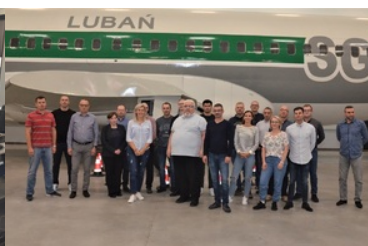
Zdjęcie grupowe uczestników szkolenia w przed kadłubem samolotu