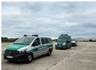
Pojazdy służbowe SG