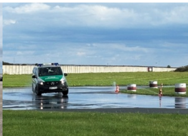
Pojazd służbowy SG