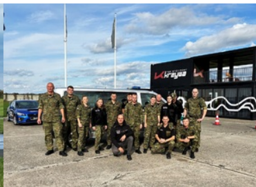
Zdjęcie grupowe uczestników szkolenia