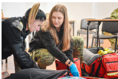
Dwie funkcjonariuszki SG w trakcie zajęć z udzielania pierwszej pomocy