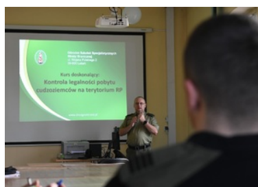
Funkcjonariusz SG prowadzący szkolenie w sali wykładowej

W przedsięwzięciu wzięli udział przedstawiciele Nadwiślańskiego, Nadodrzańskiego, Nadbużańskiego, Warmińsko-Mazurskiego, Podlaskiego, Śląskiego oraz Karpackiego Oddziału SG.