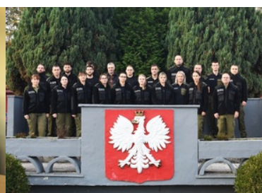
Zdjęcie grupowe funkcjonariuszy SG na trybunie Ośrodka