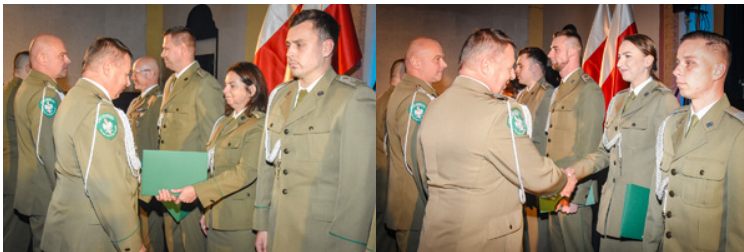
Komendant OSS SG wręczający akty mianowania na wyższy stopień SG

W korpusie oficerów awans na stopień podpułkownika SG otrzymał jeden funkcjonariusz. W korpusie chorążych - czterech funkcjonariuszy. W korpusie podoficerów awanse otrzymało pięciu funkcjonariuszy.