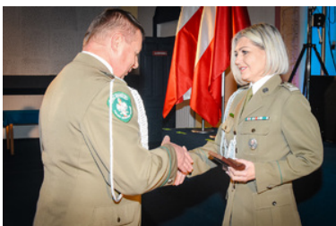
Komendant OSS SG wręczający medal za zasługi dla NSZZF SG

W trakcie uroczystości jedna funkcjonariuszka otrzymała Medal za zasługi dla Niezależnego Samorządnego Związku Zawodowego Funkcjonariuszy SG.