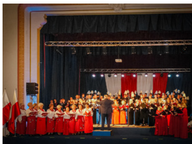
Występ chóru na scenie Miejskiego Domu Kultury w Lubaniu

Uroczystość zakończyły „Jesienne Spotkania Chóralne dla Niepodległej”.