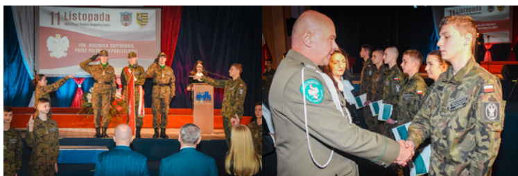
Uczniowie klasy mundurowej o profilu straż graniczna podczas ślubowania

Podczas ceremonii, pierwszoklasiści o profilu proobronnym z Zespołu Szkół Ponadgimnazjalnych im. Kombatantów Ziemi Lubańskiej w Lubaniu, pod patronatem Komendanta Ośrodka, uroczystie ślubowali na sztandar szkoły, tym samym rozpoczynając swoją drogę z mundurem.