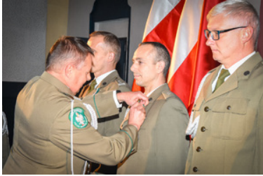
Komendant OSS SG wręczający funkcjonariuszom SG brązowy medal

Odznakę Straży Granicznej otrzymało trzech funkcjonariuszy.