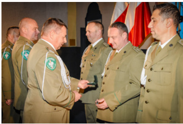
Komendant OSS SG wręczający funkcjonariuszom SG odznakę Straży Granicznej

Odznakę Straży Granicznej otrzymało trzech funkcjonariuszy.