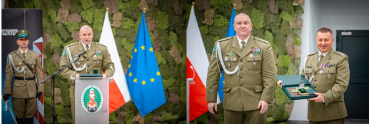
Komendant Centrum Szkolenia SG stojący przy mównicy, w tle flaga Polski i UE