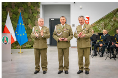
Zdjęcie grupowe Komendanta OSS SG z Dziekanem SG i Kapelanem Ośrodka