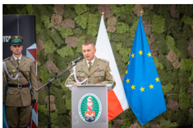
Komendant Ośrodka OSS SG stojący przy mównicy, w tle flaga Polski i UE