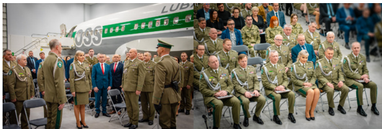
Składanie Meldunku przez Dowódcę Uroczystości - Zastępcy Komendanta Głównego SG, w tle zaproszeni goście i kadłub samolotu Boeing 737