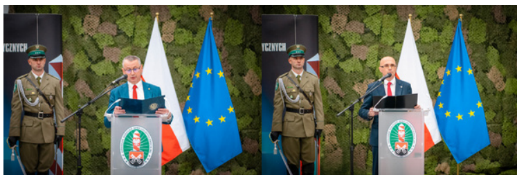
Starosta Powiatu Lubańskiego stojący przy mównicy, w tle flaga Polski i UE