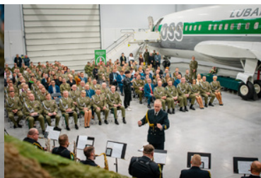
Zdjęcie Orkiestry i zaproszonych gości, w tle kadłub samolotu Boeing 737

Po mszy rozpoczęła się uroczysta zbiórka z okazji obchodów 15-lecia powstania OSS SG w Lubaniu z udziałem funkcjonariuszy i pracowników Ośrodka oraz zaproszonych gości.