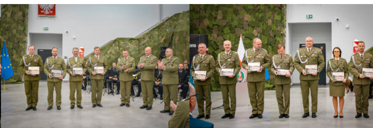
Zdjęcie grupowe odznaczonych funkcjonariuszy oraz gratulujących Komendantów OSS SG