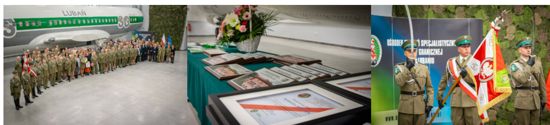
Zdjęcie grupowe uczestników uroczystości na tle kadłuba Boeinga 737

W dniu 26 listopada 2024 r. odbyła się uroczysta zbiórka z okazji 15. rocznicy powstania Ośrodka Szkoleń Specjalistycznych SG w Lubaniu.