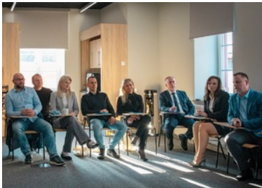
Zdjęcie uczestników warsztatów w sali wykładowej

„Wzmocnienie kompetencji i kwalifikacji Straży Granicznej w obszarze powrotów” nr FAMI.03.01-IZ.00-0003/24