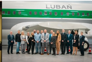
3. 02.12.24 Zdjęcie grupowe uczestników warsztatów przed samolotem w OSS SG w Lubaniu