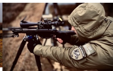
Warsztaty z taktyki i techniki działania zespołów