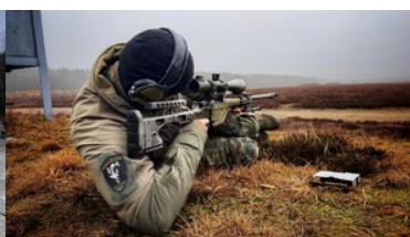
Warsztaty z taktyki i techniki działania zespołów