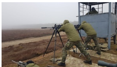
Warsztaty z taktyki i techniki działania zespołów obserwacyjno-strzeleckich