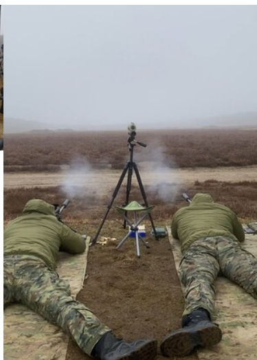
Warsztaty z taktyki i techniki działania zespołów obserwacyjno-strzeleckich