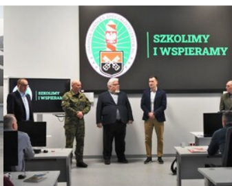
Otwarcie warsztatów w sali komputerowej