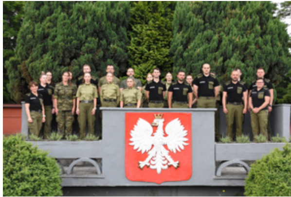
Kontrola legalności pobytu cudzoziemców na terytorium RP - II edycja