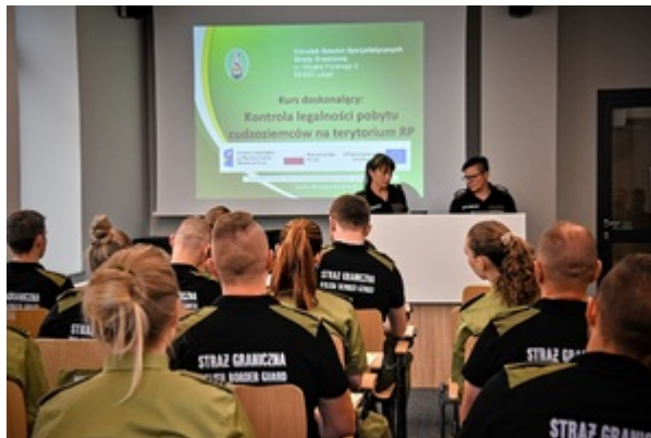
Kontrola legalności pobytu cudzoziemców na terytorium RP - II edycja