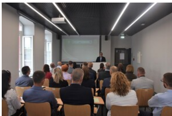
Uczestnicy warsztatów podczas zajęć