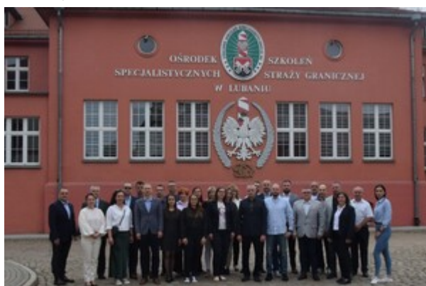
Zdjęcie grupowe uczestników warsztatów