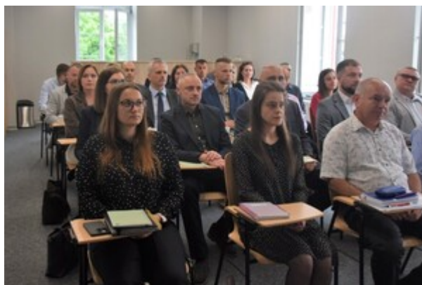
Uczestnicy warsztatów podczas zajęć