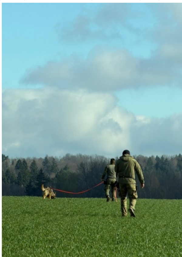
Sukces zbudowany na pasji, zaangażowaniu i setkach godzin wspólnej pracy.