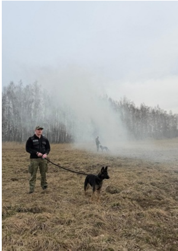
Sukces zbudowany na pasji, zaangażowaniu i setkach godzin wspólnej pracy.