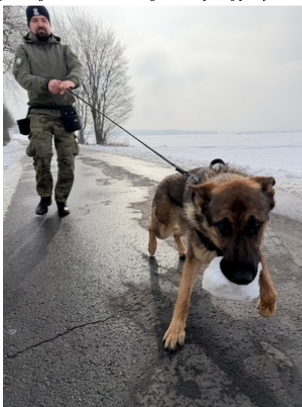
Sukces zbudowany na pasji, zaangażowaniu i setkach godzin wspólnej pracy.