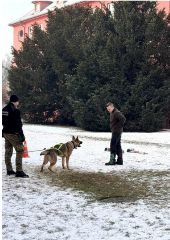
Sukces zbudowany na pasji, zaangażowaniu i setkach godzin wspólnej pracy.