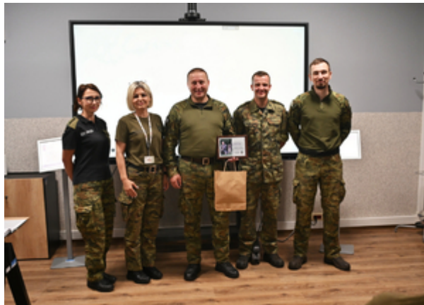
Sukces zbudowany na pasji, zaangażowaniu i setkach godzin wspólnej pracy.