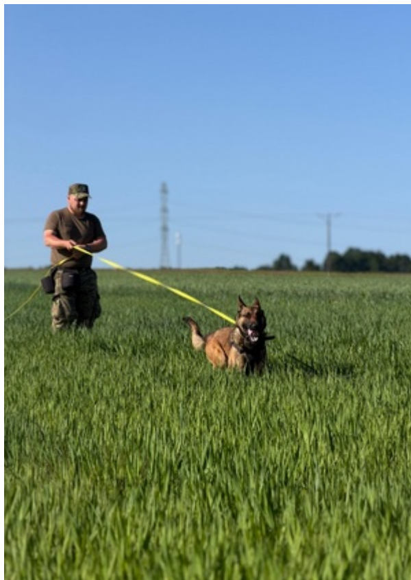
Sukces zbudowany na pasji, zaangażowaniu i setkach godzin wspólnej pracy.