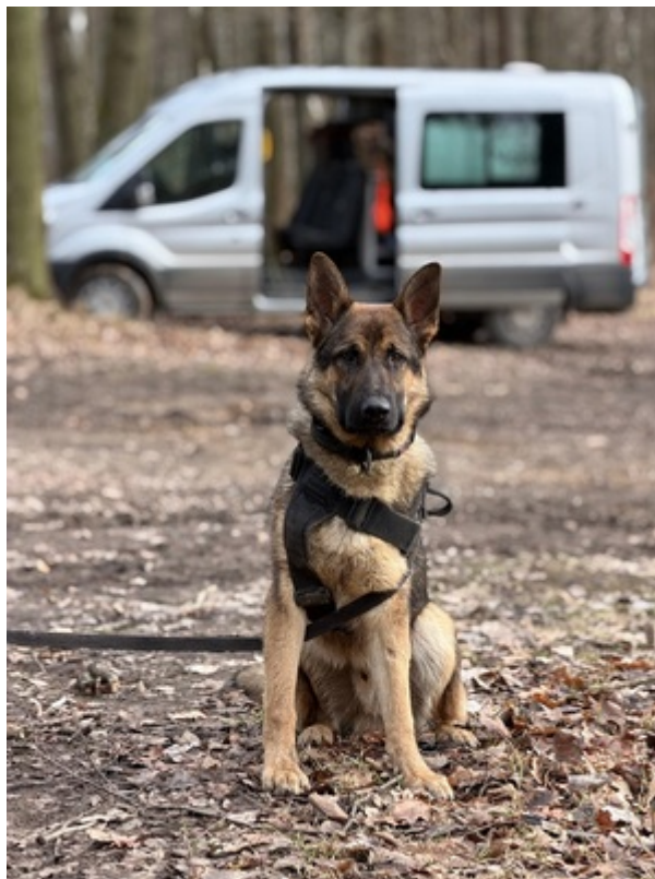
Sukces zbudowany na pasji, zaangażowaniu i setkach godzin wspólnej pracy.